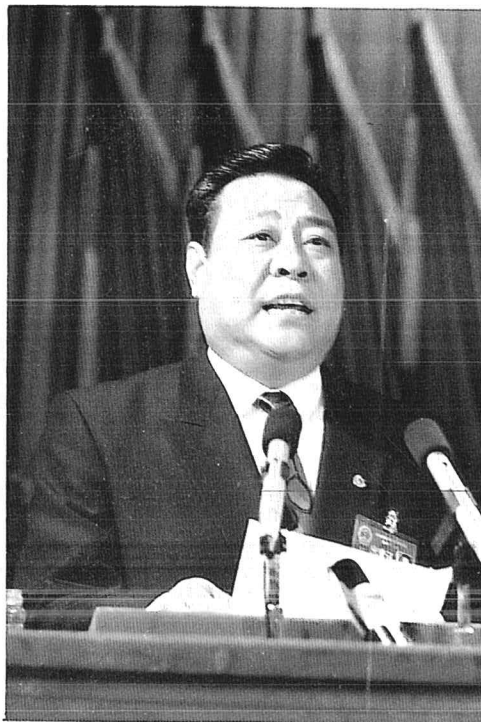
▲省长李春亭作政府工作报告