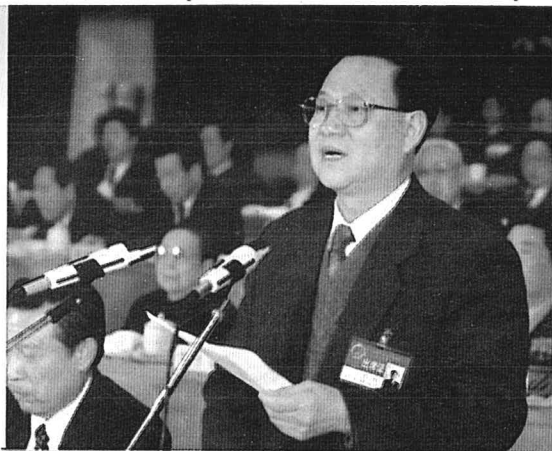
▲省人大常委会主任赵志浩向代表致辞

山东省第八届人民代表大会第四次会议于1996年2月25日至3月2日在济南召开，会议审议通过了李春亭省长代表省政府所作的《关于山东省国民经济和社会发展第九个五年计划及2010年远景目标纲要的报告》、省长助理省计划委员会主任林书香所作的《关于山东省1995年国民经济和社会发展计划执行情况与1996年国民经济和社会发展计划草案的报告》、省财政厅厅长黄可华所作的《关于山东省1995年财政预算执行情况和1996年财政预算草案的报告》；会议补选赵志浩为山东省人大常委会主任，王渭田为山东省人大常委会副主任；王大刚、王光先等9人为山东省人大常委会委员；陈抗甫为山东省副省长。会议认为，“九五”及其后10年是实现山东省“三步走”战略目标的关键时期。全省上下必须坚持“抓住机遇，深化改革，扩大开放，促进发展，保持稳定”的基本方针，正确处理改革、发展、稳定的关系，最大限度地启动改革和开放两大动力，大力促进经济体制和经济增长方式的转变。会议号召，全省人民紧密团结在以江泽民同志为核心的党中央周围，在中共山东省委的领导下，万众一心，顽强拼搏，为实现我省跨世纪的宏伟目标而努力奋斗！